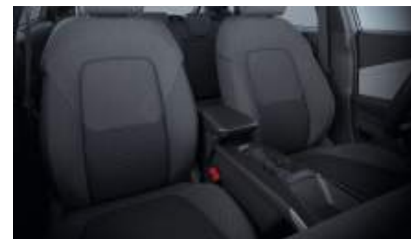
Ford Puma® Gen-E w wersji Puma w kolorze Digital Aqua Blue (wymaga dopłaty) Wnętrze: Tapicerka materiałowa (wyposażenie standardowe)