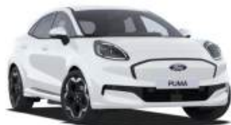
FROZEN WHITE - lakier zwykły 1 000 zł Lakier niedostępny dla wersji BlueCruise