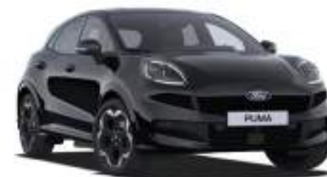
AGATE BLACK - lakier metalizowany 2 500 zł Bez dopłaty dla wersji BlueCruise