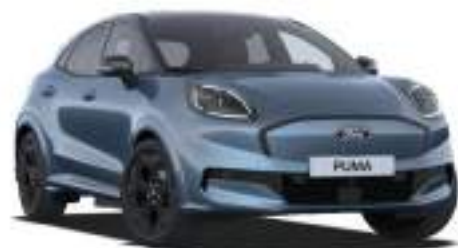
VAPOUR BLUE - lakier metalizowany specjalny Bez dopłaty Lakier dostępny dla wersji BlueCruise