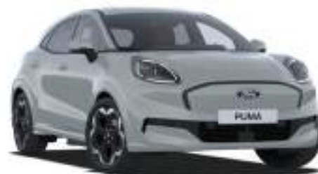
CACTUS GREY - lakier specjalny 2 500 zł Lakier niedostępny dla wersji BlueCruise