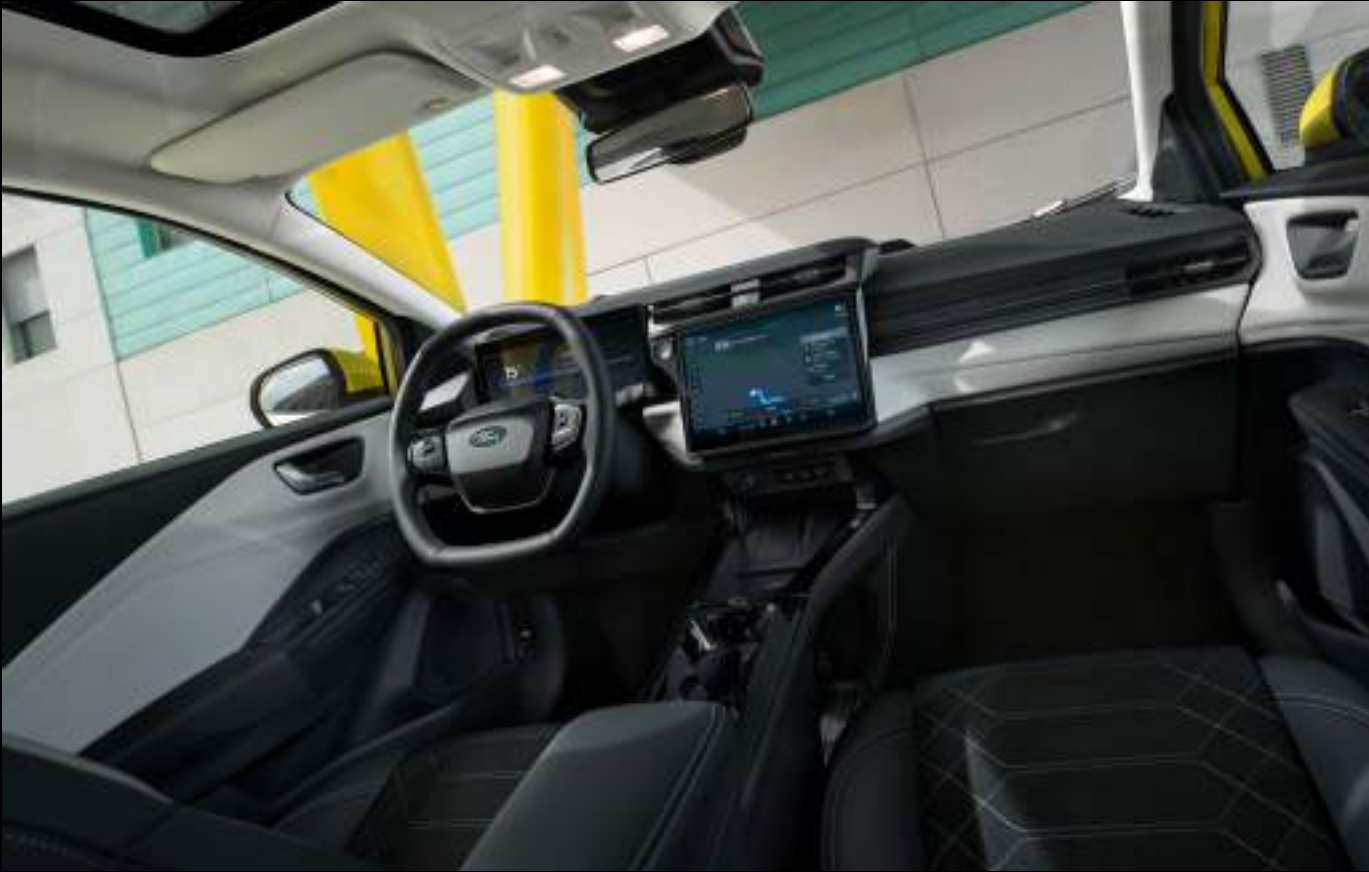
Nowy Ford Puma Gen-E® w wersji Premium z opcjonalnym wyposażeniem

Ciesz się doskonałą jakością dźwięku dzięki systemowi nagłośnienia Premium B&O, który obejmuje wzmacniacz o mocy 650W, 10 głośników (w tym subwoofer) - standard w wersji Premium. Przeniesienie dźwigni zmiany biegów na kierownicę pozwoliło wygospodarować dodatkowy, pojemny schowek pomiędzy fotelami.