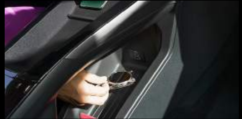
Bezprzewodowa ładowarka do smartfonów Wyposażenie standardowe dla wersji Premium i BlueCruise