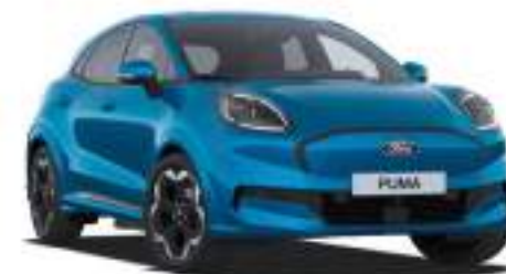
DIGITAL AQUA BLUE - lakier metalizowany specjalny 2 500 zł Lakier niedostępny dla wersji BlueCruise