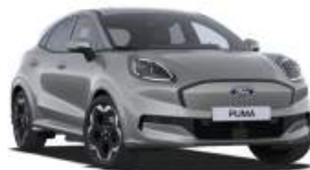
SOLAR SILVER - lakier metalizowany 2 500 zł Bez dopłaty dla wersji BlueCruise