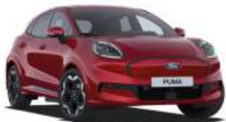
FANTASTIC RED - lakier metalizowany specjalny 3 800 zł Lakier niedostępny dla wersji BlueCruise