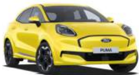
ELECTRIC YELLOW - lakier zwykły bez dopłaty Lakier niedostępny dla wersji BlueCruise