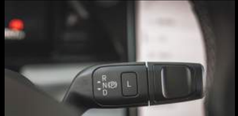
Dźwignia zmiany biegów - przy kierownicy Wyposażenie standardowe wszystkich wersji