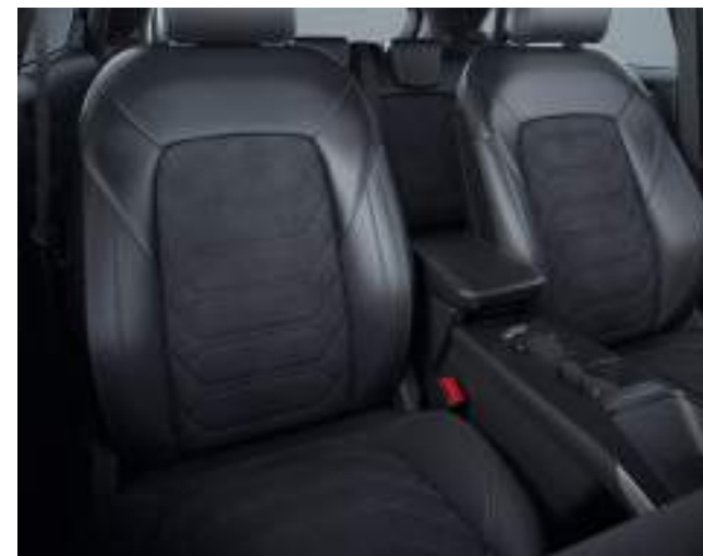
Ford Puma® Gen-E w wersji Premium z pakietem Black